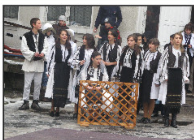
XI A în Peșitul miresei