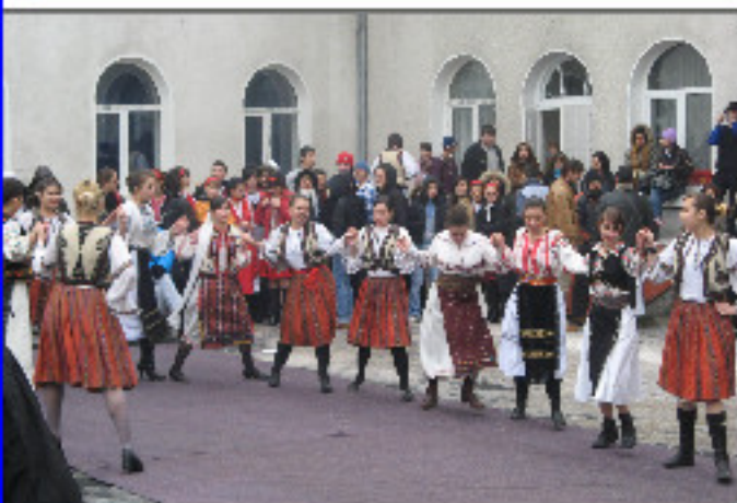
X D și dansul moldovenesc