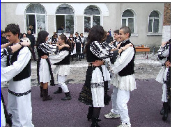
Elevii clasei a X-a B reprezentând Sibiu!