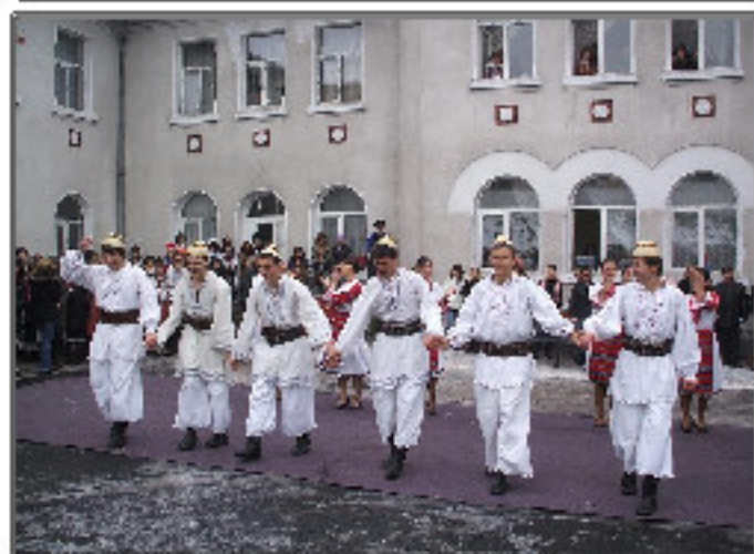
Dans din Țara Oașului

Referindu-mă la un anumit punct din filmul românesc "Cum mi-am petrecut sfârșitul lumii", îmi permit să modific într-o minimă măsură titlul acestui film în "Unde mi-am petrecut sfârșitul lumii". Răspunsul nu poate fi decât unul: România; aici, unde sfârșitul lumii este în fiecare zi.