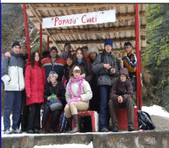
Prima excursie a Cercului Montan din liceul nostru: 8 decembrie 2007